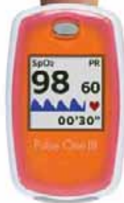
マンゴーオレンジ