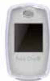
シルバーホワイト