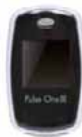
メタリックブラック