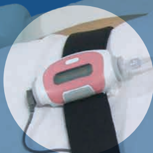
ユニットは 上腹部に装着