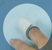
SpO 2 プローブ